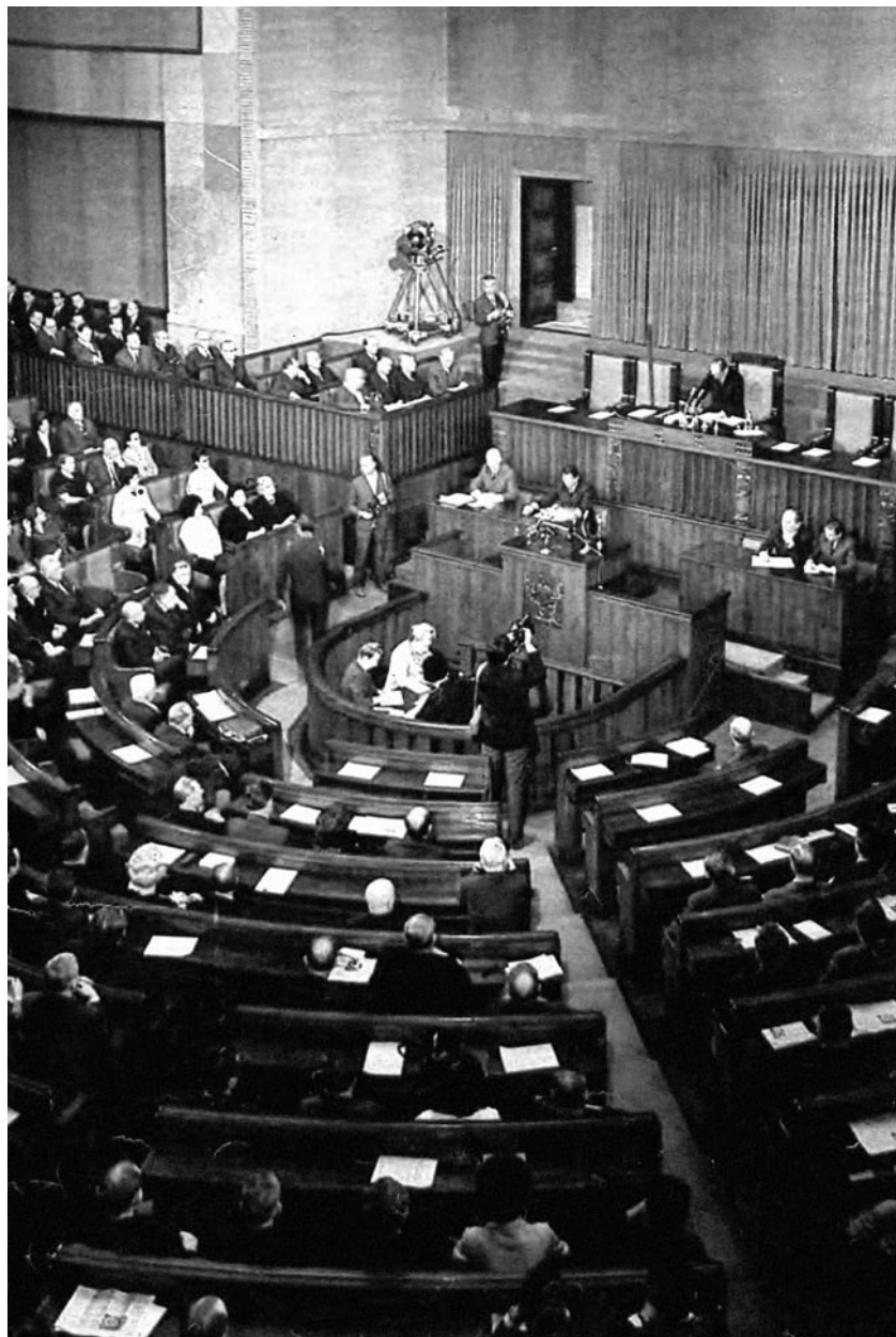
Заседание на Полския сейм, април 1968 (Stolica, 16/1968, корица, снимка: Я. Смогожевски).