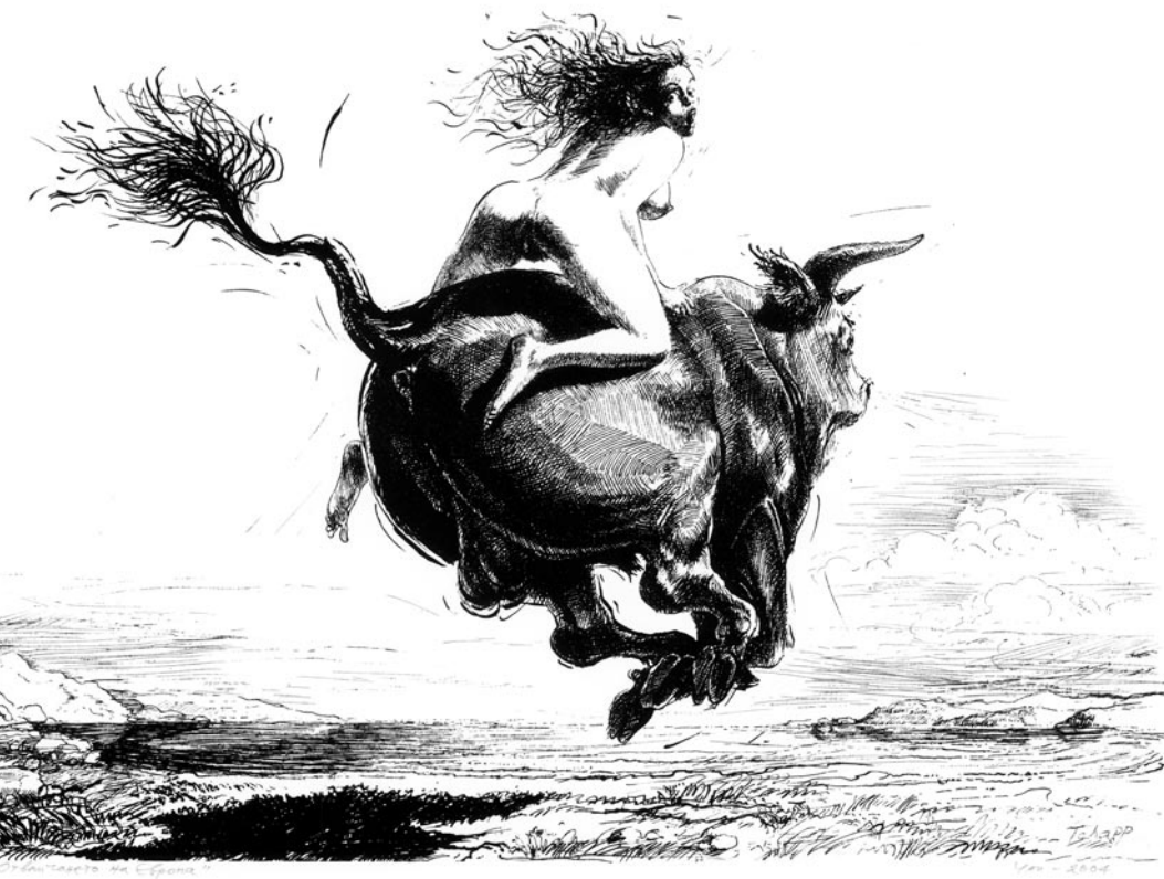
„Похищението на Европа“ (стр. 274) „Музи, уплашени от паяк“ (стр. 275)