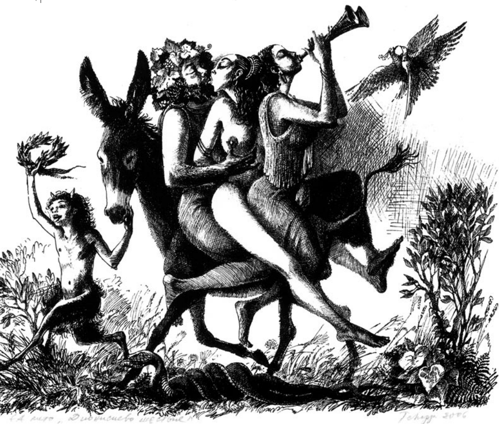
„Дионисиево шествие“ (стр. 278) „Следобег“ (стр. 279) „Адам и Ева“ (стр. 280)