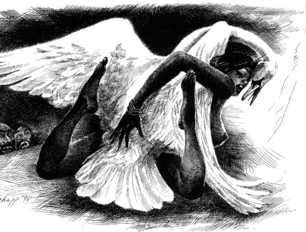
„Леда и лебеда“